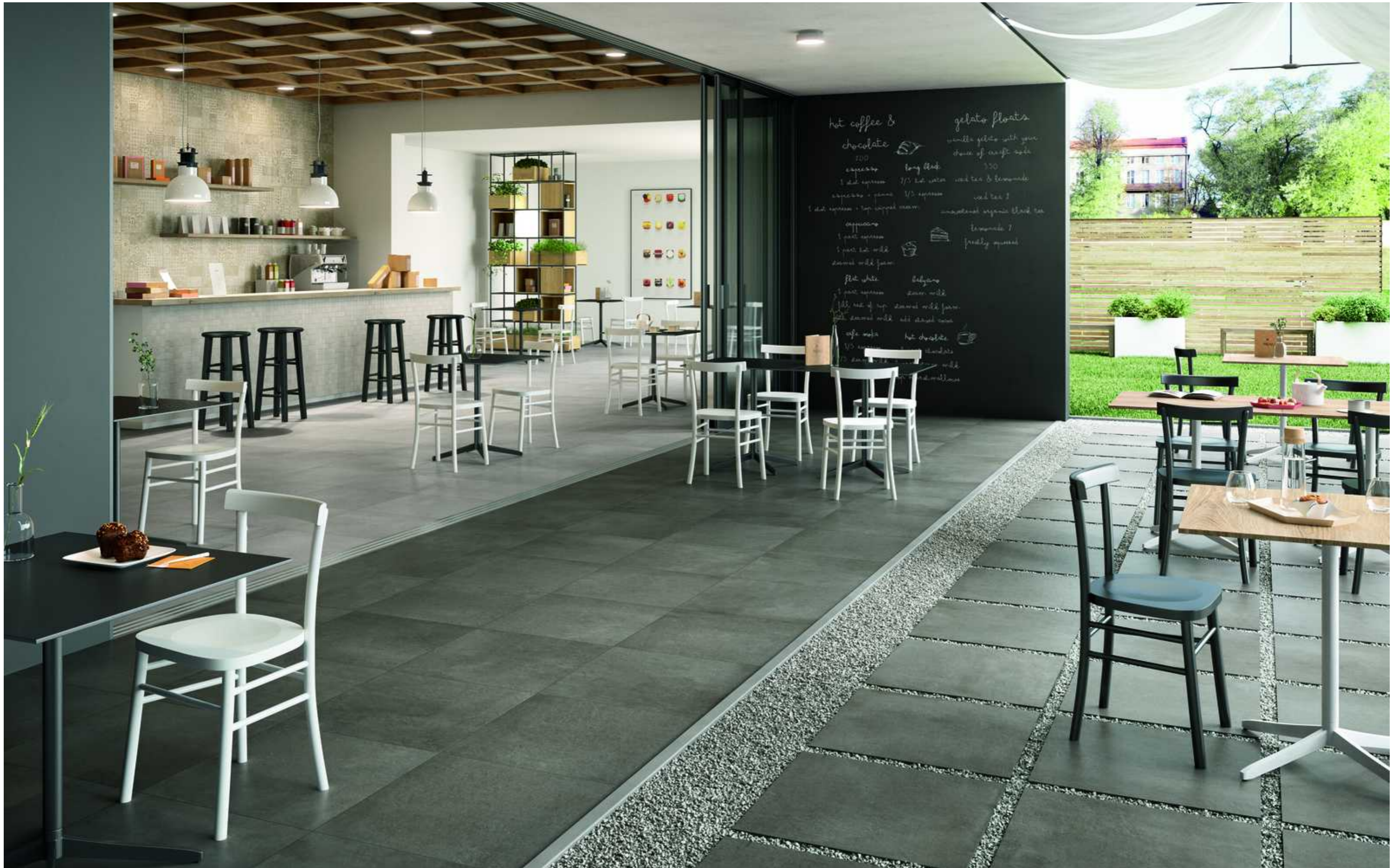
MMCP Plaster Anthracite 20 60x60cm MMAY Plaster Grey Rt 60x60cm