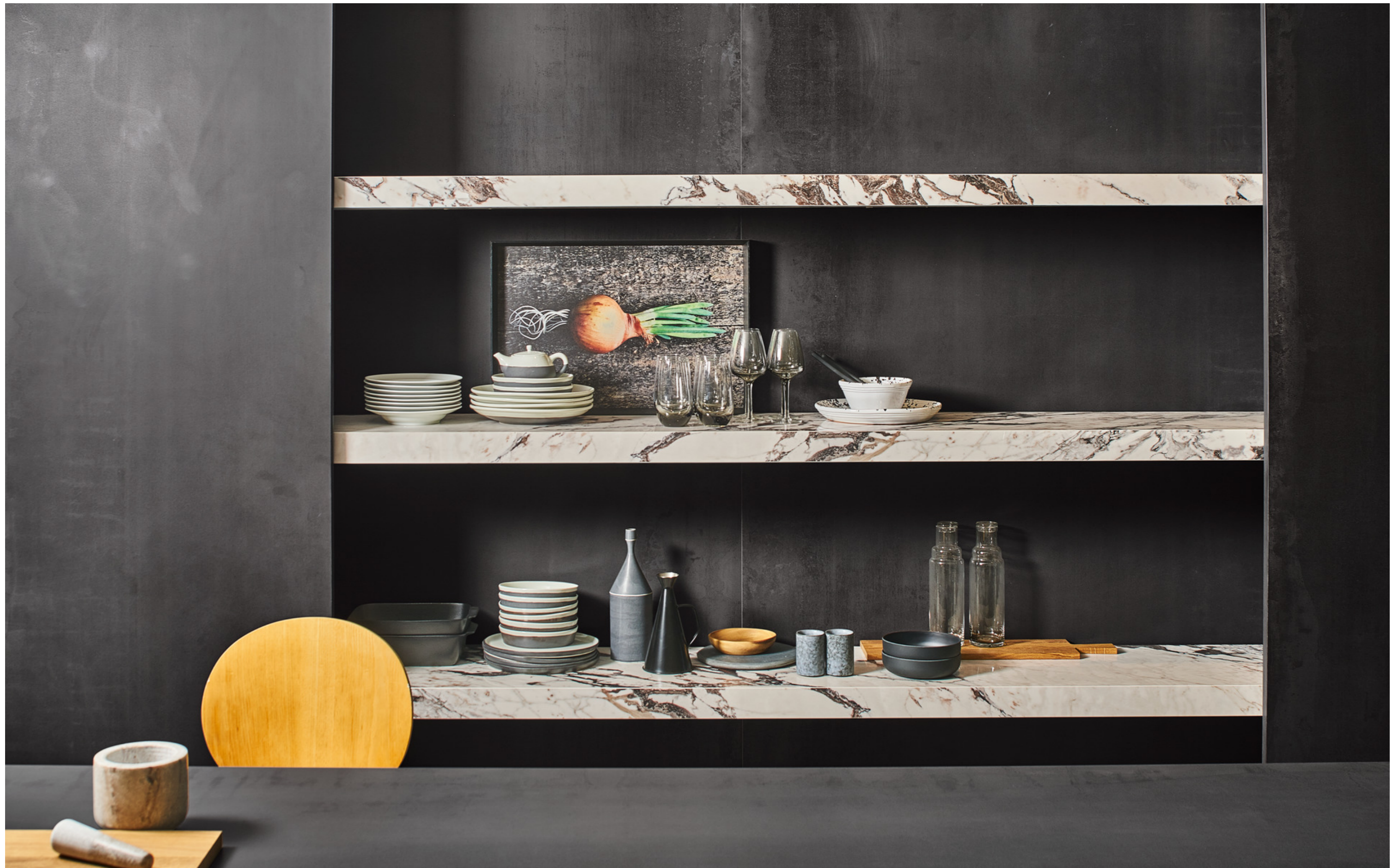
M11C Grande Metal Look Iron Dark Metal Rt 6Mm 160x320cm MOZH Grande Marble Look Capraia Bookmatch A Lux 12Mm 162x324cm