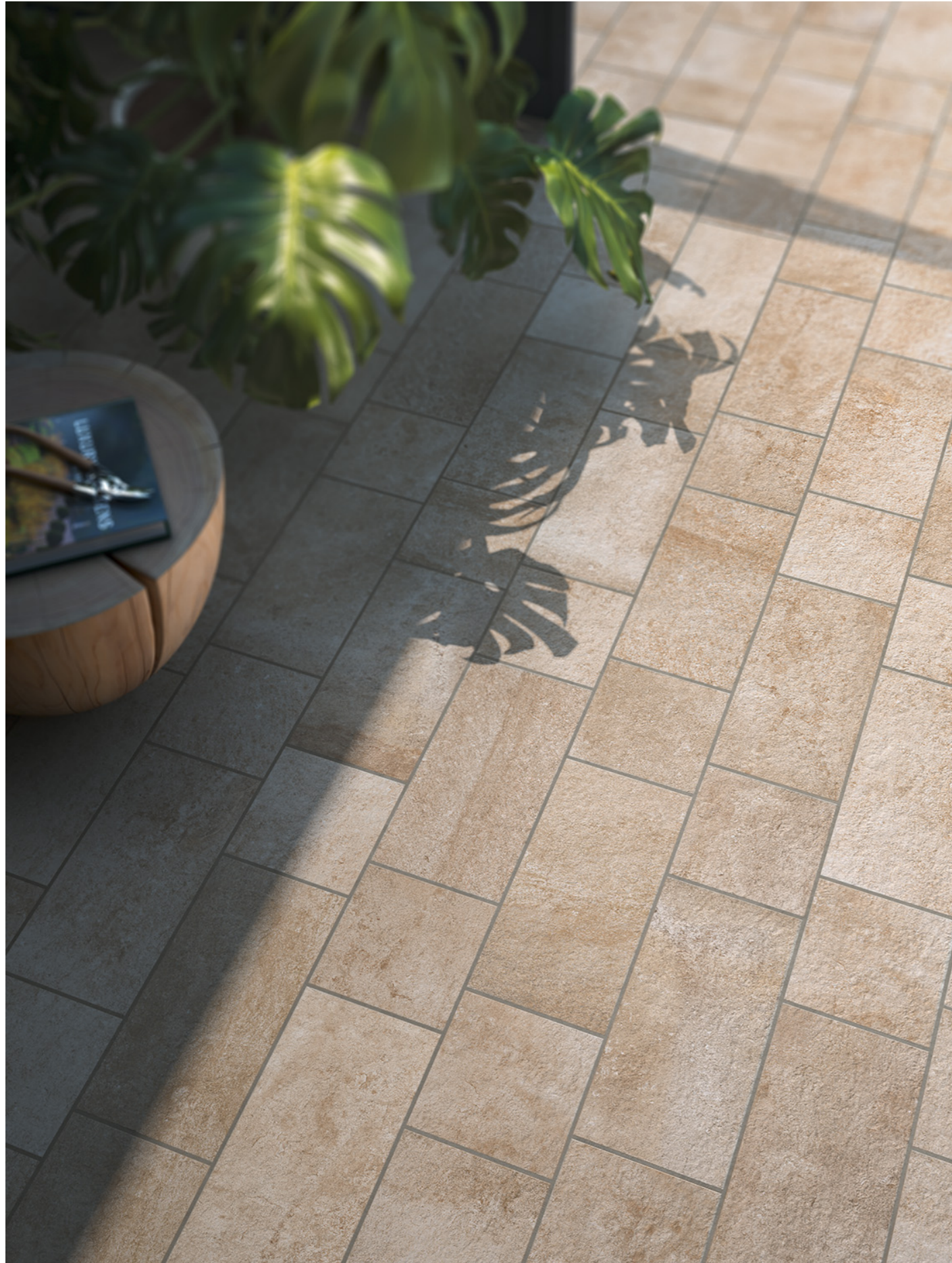
MH7C Pietra Occitana Beige 20x40cm MH77 Pietra Occitana Beige 20x20cm