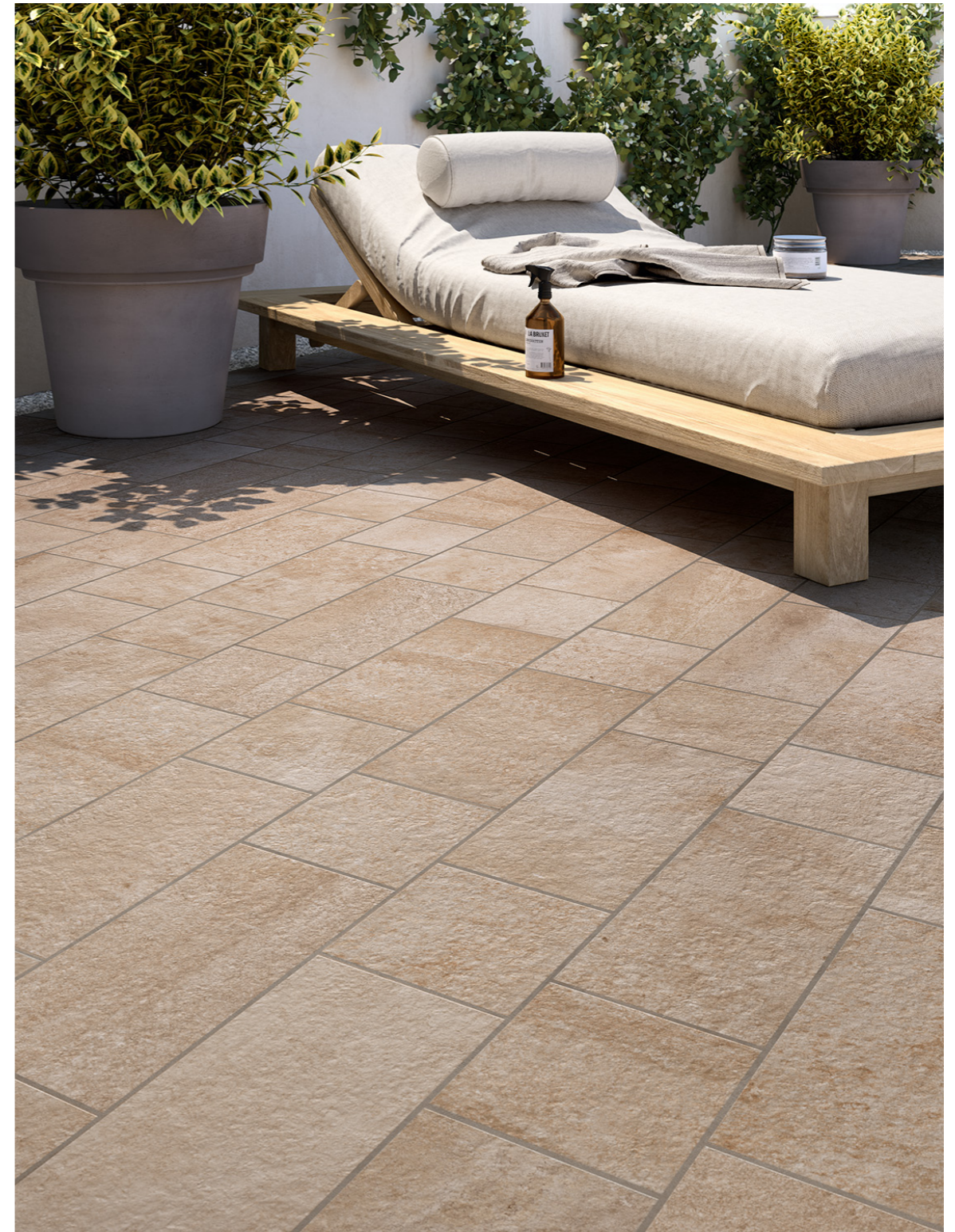
MH7C Pietra Occitana Beige 20x40cm MH77 Pietra Occitana Beige 20x20cm